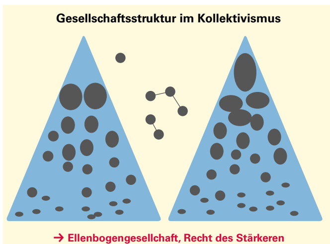
Abbildung 1: Eigene Darstellung

Anderen gelingt es, das enge Korsett des Kollektivs freiwillig zu verlassen und sich selbst zu verwirklichen. Allerdings ebenfalls zum hohen Preis der Schutzlosigkeit. Dies kann auf dem Land oder in unwirtlichen Gegenden (lebens-)bedrohlich sein. In urbanen Regionen können die einzelnen Individuen sich manchmal zusammenschließen und über diese Netzwerke Hilfe und neue Möglichkeiten erfahren. Die verschiedenen Kollektive sind im ständigen Wettbewerb. Daher ist es unerlässlich, dass jedes Mitglied ständig auf die Vorteile des eigenen Kollektivs bedacht ist. Dies ist die Grundlage für das Entstehen einer sogenannten „Ellenbogengesellschaft“ oder schlimmstenfalls einer Ordnung, in der das Recht des Stärkeren gilt. Wer eine Machtposition innehat, nutzt diese häufig zum Vorteil der eigenen Verwandtschaft, und somit des eigenen Kollektivs. In vielen kollektivistisch geprägten Gesellschaften ist dies akzeptiert. Um eigene Vorteile zu erlangen, können aber auch – sofern es keine verwandtschaftlichen oder freundschaftlichen Verhältnisse zu Menschen in Machtpositionen gibt – Bestechungsgelder oder Bestechungsvorteile entrichtet werden.